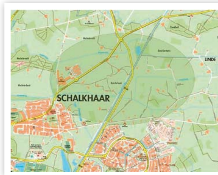
Overzichtskaart gebied Deventer Noord Oost

Aan deze uitgave kunt u geen rechten ontlenen.