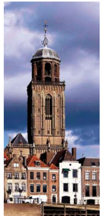
Deventer, 28 juni 2009

Er is veel waarvoor het hoofd in deemoed wordt genegen, maar ik glorieer in dit scharnier van mijn bestaan: het paradijs is mijlen verderop gelegen, maar deze stad beschut mij reeds tot halverwege.