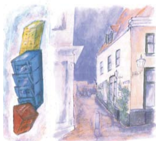
Aquarel van Gerda Pelger

En dan is er natuurlijk de muurschildering. De planning had niet mooier kunnen zijn, want het Meester Geertshuis werd net onder handen genomen. De steiger van het schildersbedrijf mocht een paar dagen langer blijven staan, zodat kunstenaar Hens Odinet van Atelier Droom & Daad veilig de schildering aan kon brengen.