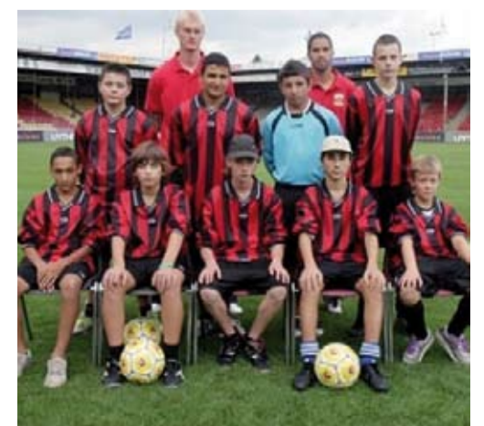
Het winnende team 'Rode Dorp'

Vanwege de positieve reacties van de deelnemers en de buurtbewoners, wil Go Ahead Eagles de straatvoetbalcompetitie voortzetten en het liefst laten uitgroeien tot een jaarlijks terugkerend evenement.