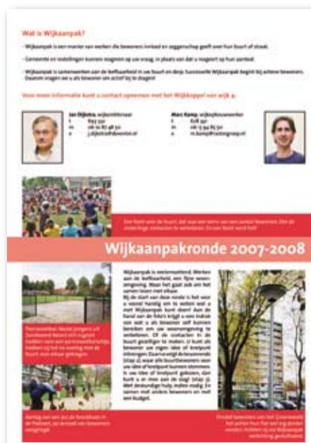
De kaart van de wijkiaanpakronde 2007-2008. Een vergelijkbare valt in januari bij alle bewoners in de bus

onderlinge contacten tussen bewoners gaat regelen, maar we willen wel heel graag dat eerste zetje geven!'