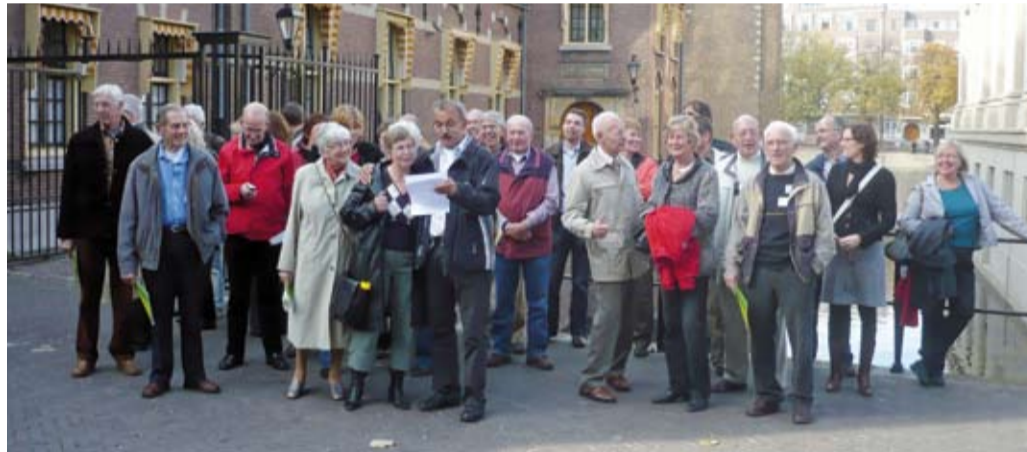
Foto: Wijkteams op het Binnenhof