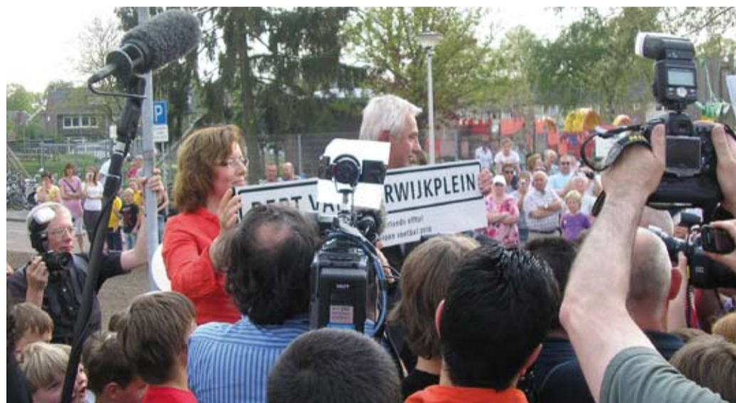
Op de Hoven is op 21 april onder grote belangstelling het Bert van Marwijkplein geopend door niemand minder dan Bert van Marwijk zelf. Naast de vele Hovenbewoners was er ook voldoende pers aanwezig. Kinderen hadden een geweldige sportactiviteit bij het Hovenhuus en jongeren konden zich sportief uitleven in het Worpplantsoen.

Er wordt de komende jaren flink gegraven aan de Worpoever en vanaf de jachthaven richting Olst om overstromingen van de IJssel te voorkomen. De selectie van de aannemer is in volle gang. Intussen zijn er voorbereidende werkzaamheden, zoals het onschadelijk maken van explosieven en archeologisch onderzoek.