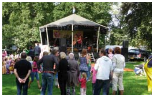
Dit jaar is het festival in de 'echte' muziekkoepeel.

Op 9 september wordt de muziekkoepeel op de Worp officieel geopend. En op zaterdag 10 sep-