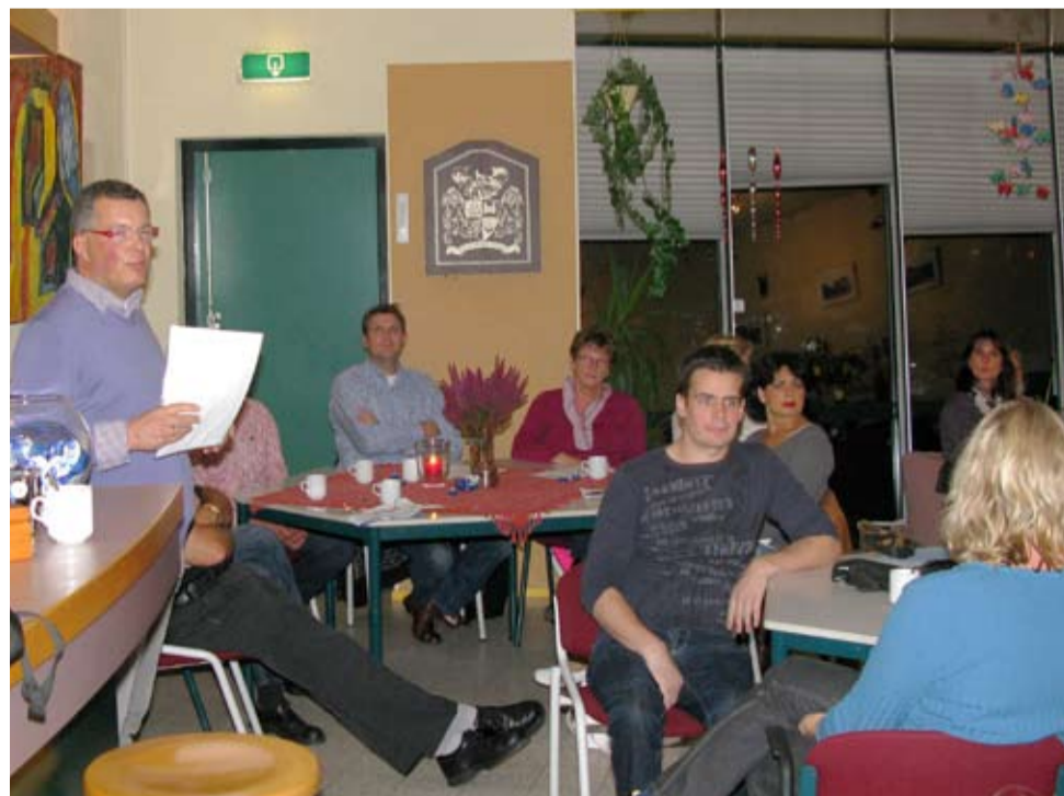
DE WIJKMANAGER AAN HET WOORD BIJ DE TERUGKOMAVOND IN WIJK 5 ZUID

Vier taakgroepen in Wijk 5 Zuid zoeken een oplossing voor verschillende verkeers- en parkeerproblemen in de wijk. De ideeën zijn