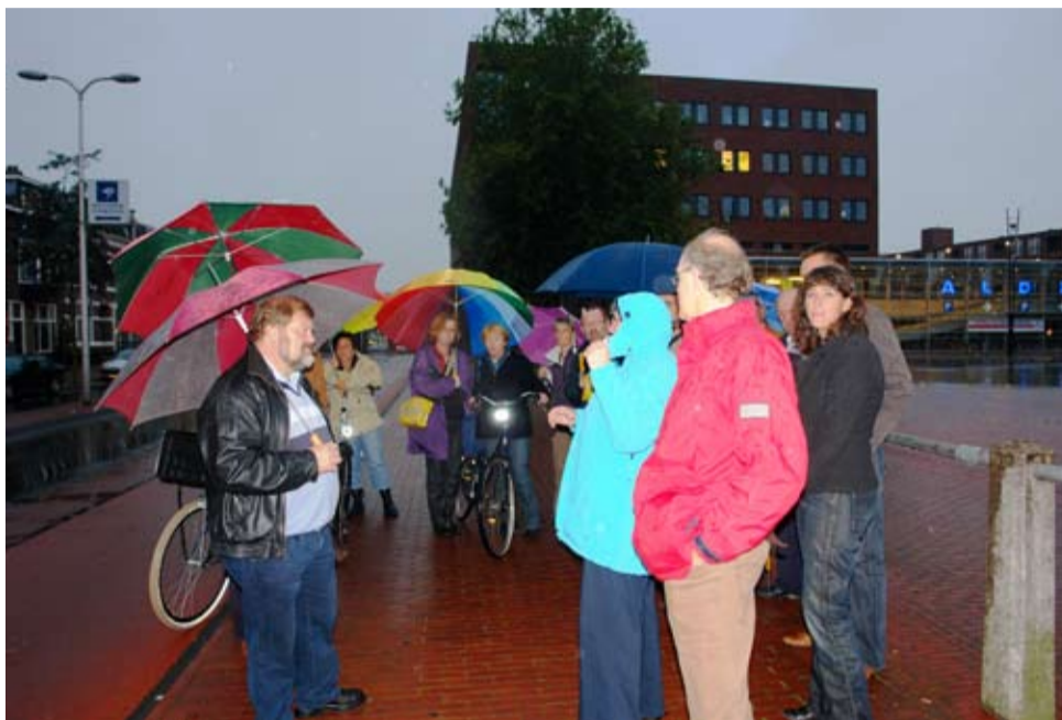
RAADSLEDEN WANDELEN MET LEDEN TAAKGROEP VINGER AAN DE POLS LANGS HOTSPOTS IN VOORSTAD OOST

Ondanks de regen, was er op dinsdag 6 oktober volop belangstelling voor een wandeling langs een aantal hotspots in Voorstad Oost. De wandeling was een initiatief van taakgroep Vinger aan de Pols die de raad had uitgenodigd. Doel was om, voorafgaand aan de presentatie van de Visie Voorstad Oost op woensdag 21 oktober, kennis te nemen van de punten in de buurt waar bewoners aandacht voor vragen en die in de visie Voorstad Oost in een aantal thema's is