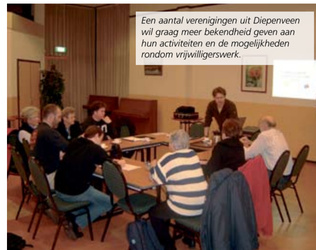
Een aantal verenigingen uit Diepenveen wil graag meer bekendheid geven aan hun activiteiten en de mogelijkheden rondom vrijwilligerswerk.

Is het mogelijk om met elkaar de zorg op ons te nemen voor mensen die bepaalde dingen niet meer kunnen? Met die vraag wil een aantal bewoners binnen Lettele graag aan de slag. Dit is één van de punten die tijdens de keuzeavond op 14 maart aan bod komen.