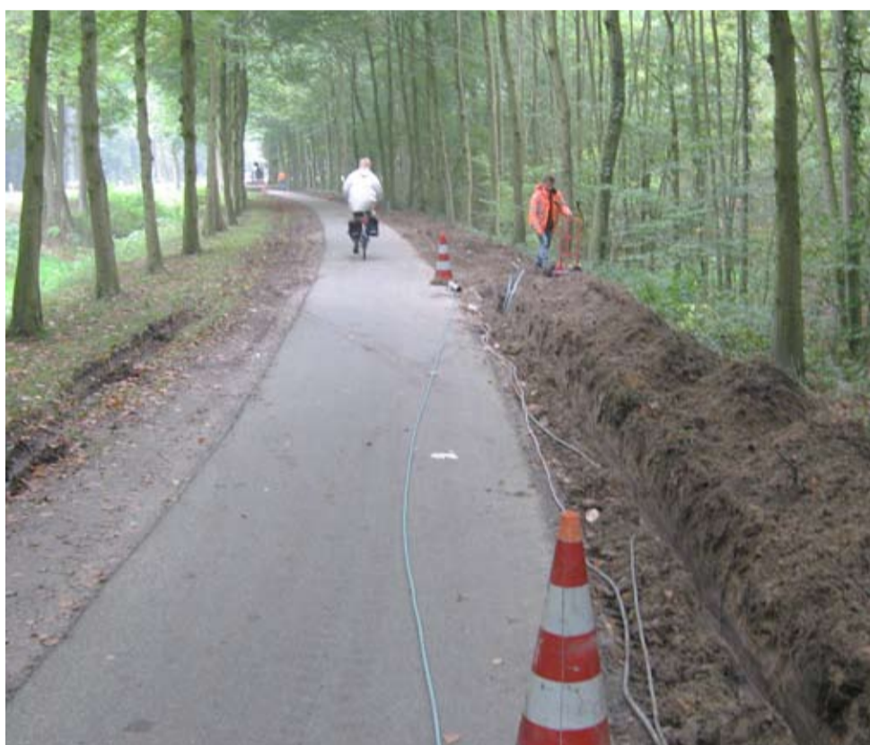
De Fietsbond heeft met een laboratoriumfiets de kwaliteit van de fietspaden getest, zoals hier bij Bathmen. Elke hobbel of kuil wordt geregistreerd door speciale trillingsapparatuur.

De gemeente is met de NS in gesprek over extra fietsstallingen bij het NS Station.