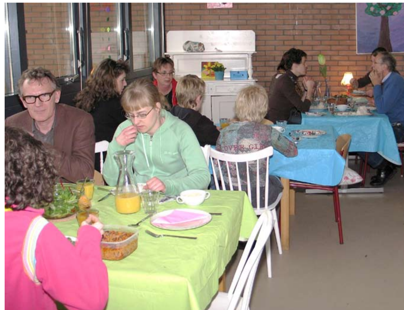
Gezellig aan tafel bij Potje van Otje.