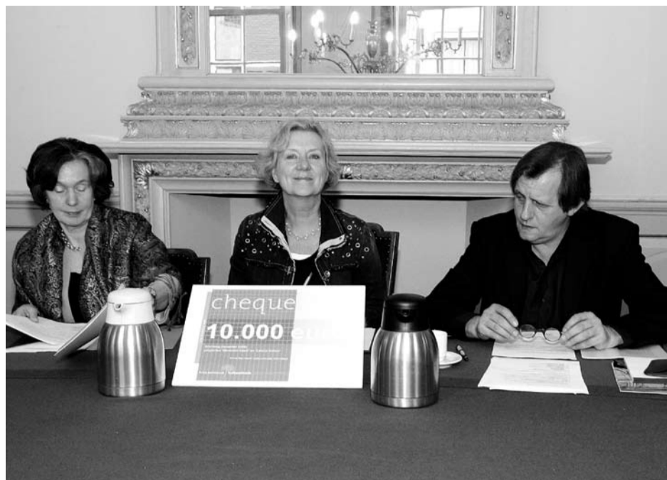
Tijdens een presentatie op maandag 28 april in de Oude Raadszaal van het Stadhuis van Deventer vertelde het VVV aan iedereen die het wilde horen over

Voor meer informatie kunt u contact opnemen met dit team via telefoon 693999.