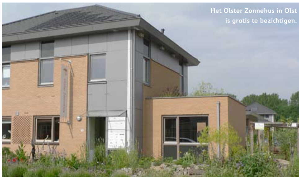
Het Olster Zonnehuis in Olst is gratis te bezichtigen.

De warmte wordt geregeld door de zogeheten Klimarad. Een warmtewisselaar die de lucht ventileert. Koude buitenlucht wordt via een ingenieus systeem opgewarmd tot kamertemperatuur waarna het door de woning verspreid wordt. Luijters: "Je hebt niet het gevoel dat het tocht." De badkamer is van kalkleem gemaakt met waterafstotend materiaal. Een centraal stofzuigsysteem zuigt alles op. Al deze voorzieningen zorgen voor een aangenaam binnenklimaat, in het bijzonder voor astmapatiënten.