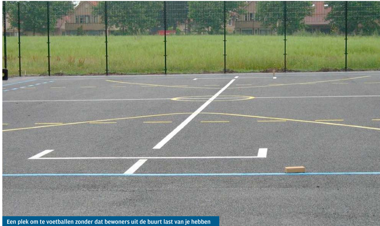
Een plek om te voetballen zonder dat bewoners uit de buurt last van je hebben

Een plek om te voetballen zonder dat bewoners uit de buurt last van je hebben of waar je gewoon een beetje kan kletsen met je vrienden. Dat willen jongeren in Wijk 5. Deze wens gaat op 16 juli in vervulling. Dan wordt om 17.00 uur de voetbal- en basketbalarena op een feestelijke manier geopend door