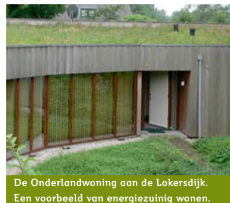
De Onderlandwoning aan de Lokersdijk. Een voorbeeld van energiezuinig wonen.

zomer weert het de hitte van buiten. En kijk eens naar die planten? Dat is toch prachtig! Vogels en insecten komen er op af en af en toe zie ik ook wel eens eekhoorns op ons dak lopen," vult zijn vrouw aan. "We hebben er weinig werk aan. Af en toe wat onkruid verwijderen, dat is alles. En het compenseert extra CO2-uitstoot. De temperatuur in huis wordt automatisch geregeld via een energiezuinige warmtepomp. Meetapparatuur op het dak voelt de buitentemperatuur en pompt grondwater omhoog. Al naar gelang het weerbeeld stroomt er vervolgens verwarmd of gekoeld water door de vloerverwarming. "Wij hebben geen stroomverslindende airco meer nodig en ook