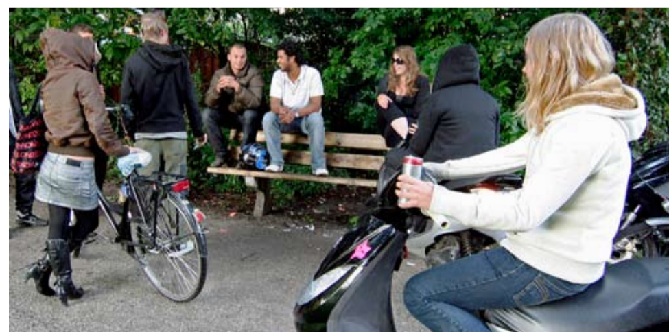
De nieuw aangelegde ontmoetingsplek voor jongeren aan de Siemelinksweg

gezamenlijk convenant opgesteld en wordt de bouwvergunning van de overkapping aangevraagd. Mocht blijken dat het niet lukt om de afspraken na te komen dan is de ultieme consequentie dat het college van Burgemeester en Wethouders besluit de JOP te verwijderen.