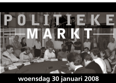
woensdag 30 januari 2008

plaatsgevonden Op 16 januari is aan insprekers de gelegenheid gegeven in te spreken en hebben raadsleden vragen gesteld Op 30 januari 2008 vindt een opiniërend debat plaats in de politieke markt. Een beoordelingscommissie beoordeelt de plannen, waarbij ook rekening wordt gehouden met de uitkomsten van het publieksdebat, het opiniërende debat in de politieke markt en uitkomsten publieksenquëtte. In april 2008 beslist de raad op voorstel van het college