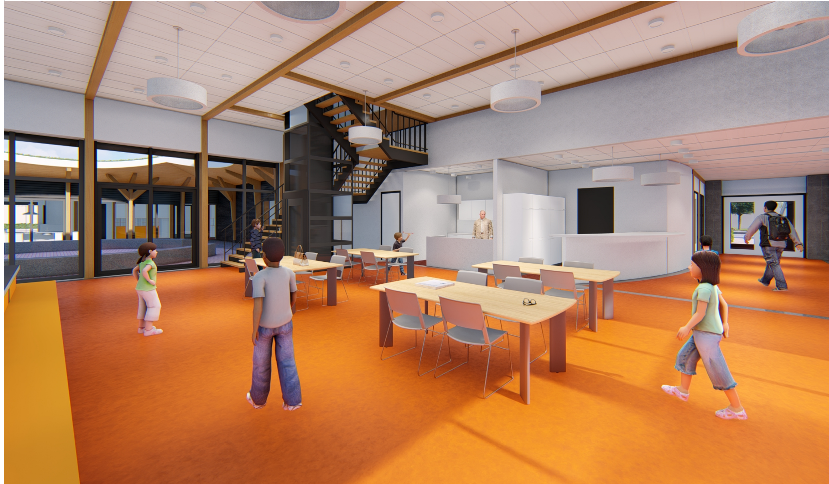
MULTIFUNCTONELE RUIMTE D0.5