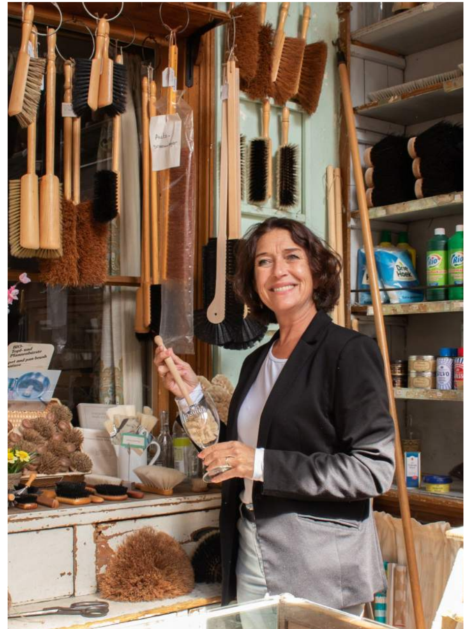
AFBEELDING: ONDERNEMER IN HAAR HISTORISCHE BORSTELWINKEL, MENSTRAAT

De gemeente verleent zelf ook een scala aan diensten aan ondernemers. Denk aan vergunningverlening, toezicht en handhaving, en klantcontacten aan telefoon en balie. In het sociale domein zijn er veel diensten voor bedrijven als werkgever. Het is belangrijk dat deze dienstverlening op orde is en geen onnodige drempels opwerpt. Een kans om initiatieven beter te ondersteunen ontstaat met de komst van de Omgevingswet die juist dát als een van haar doelstellingen heeft.