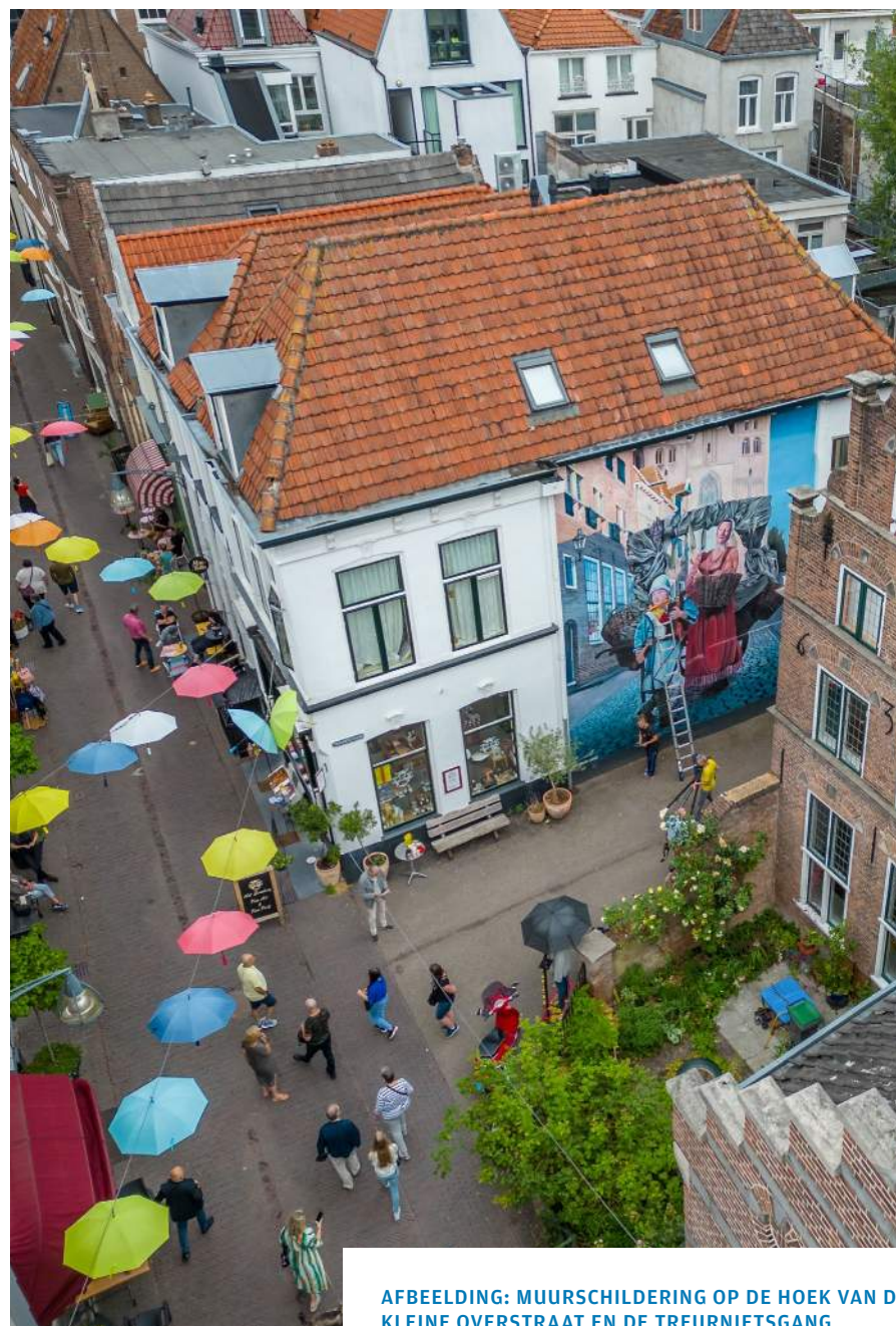
AFBEELDING: MUURSCHILDING OP DE HOEK VAN DE KLEINE OVERSTRAAT EN DE TREURNIETSGANG

Samen met hen werken we aan een goed vestigingsklimaat, de ontwikkeling van de binnenstad en specifieke plekken als het Stadshof, de pleinen en het Broederenkwartier in een place to be, vernieuwend ondernemerschap en een groeiend aantal bezoekers. We investeren ook in een openbare ruimte die aantrekkelijk is als verblijfsgebied en die mogelijkheden biedt voor klimaatadaptatie, groen en slimme en schone vormen van mobiliteit. De binnenstad is dé plek voor toepassing van innovatieve technieken, talentontwikkeling en samenwerking met onderwijs en studenten. Met onze investeringen nodigen we anderen uit bij te dragen aan de kwaliteit van de binnenstad. Dit levert een bijdrage aan verschillende SDG's, waaronder Industrie, innovatie en infrastructuur (SDG 9), Klimaatactie (SDG 13) en Partnerschappen (SDG 17) om doelstellingen te bereiken.