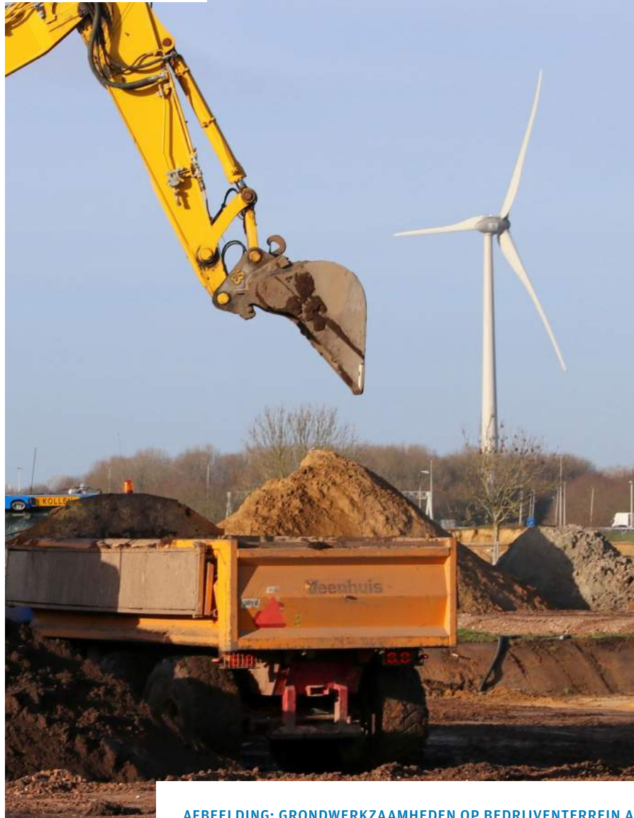
AFBEELDING: GRONDWERKZAAMHEDEN OP BEDRIJVENTERREIN A1

Voor u ligt de opvolger van de ‘Uitvoeringsagenda Economie en Internationaal beleid 2019-2022’. De afgelopen 4 jaar gaven we met die agenda als gemeente inzicht in de wijze waarop we in nauwe samenwerking met ondernemers en onderwijsinstellingen werkten aan de versterking van de Deventer economie. Ook vormde het de leidraad voor gesprekken met de raad over economische ontwikkelingen en internationale activiteiten in onze gemeente.