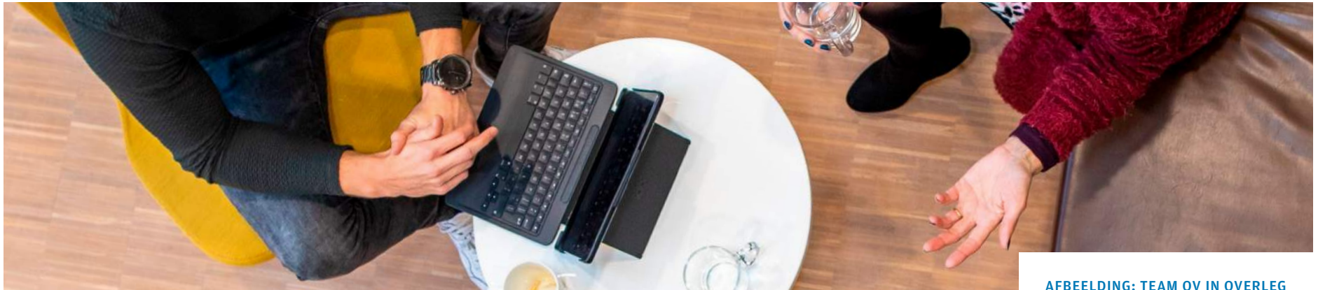
AFBEELDING: TEAM OV IN OVERLEG

Het programma Economie werkt nauw samen met de overige beleidsprogramma's en projecten om het economisch perspectief onderdeel te laten zijn van integrale afwegingen.