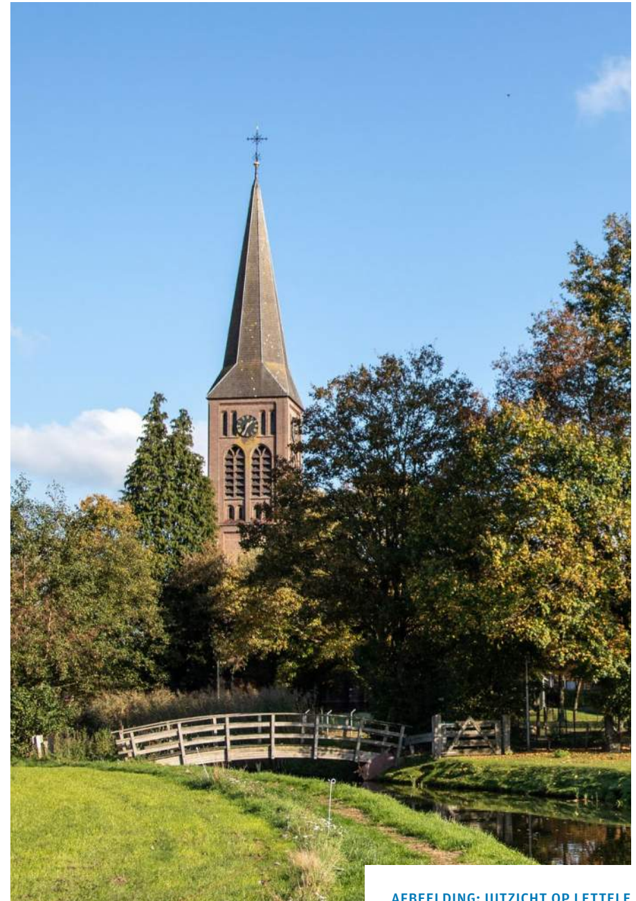
AFBEELDING: UITZICHT OP LETTELE

Deventer kenmerkt zich door de historische binnenstad aan de IJssel en het groene ommeland. De combinatie van stad én platteland heeft een grote aantrekkingskracht op bewoners, toeristen en bezoekers. Daarom vinden we het belangrijk om in nauw contact te zijn met ondernemers op het platteland en in de dorpen die investeren in de voorzieningen in het buitengebied. Het gaat dan met name om vitale horeca, detailhandel en toeristische en recreatieve voorzieningen. In onze marketing is veel aandacht voor Salland waarvan onze dorpen en buitengebied onderdeel uitmaken. Ook organiseren we regelmatig ondernemersavonden in de dorpen om te horen hoe het gaat en om in gesprek te gaan. Ondernemers die met vestigingsvraagstukken zitten, krijgen volop aandacht en begeleiding. Bedrijven in de dorpen en op het platteland dragen bij aan de sociale cohesie, innovatieve kracht en werkgelegenheid van die gebieden. We onderzoeken daarom of er voldoende ruimte is voor lokale bedrijven om zich te vestigen en verder te ontwikkelen. We betrekken hun vraag bij de programmering van de werklocaties.