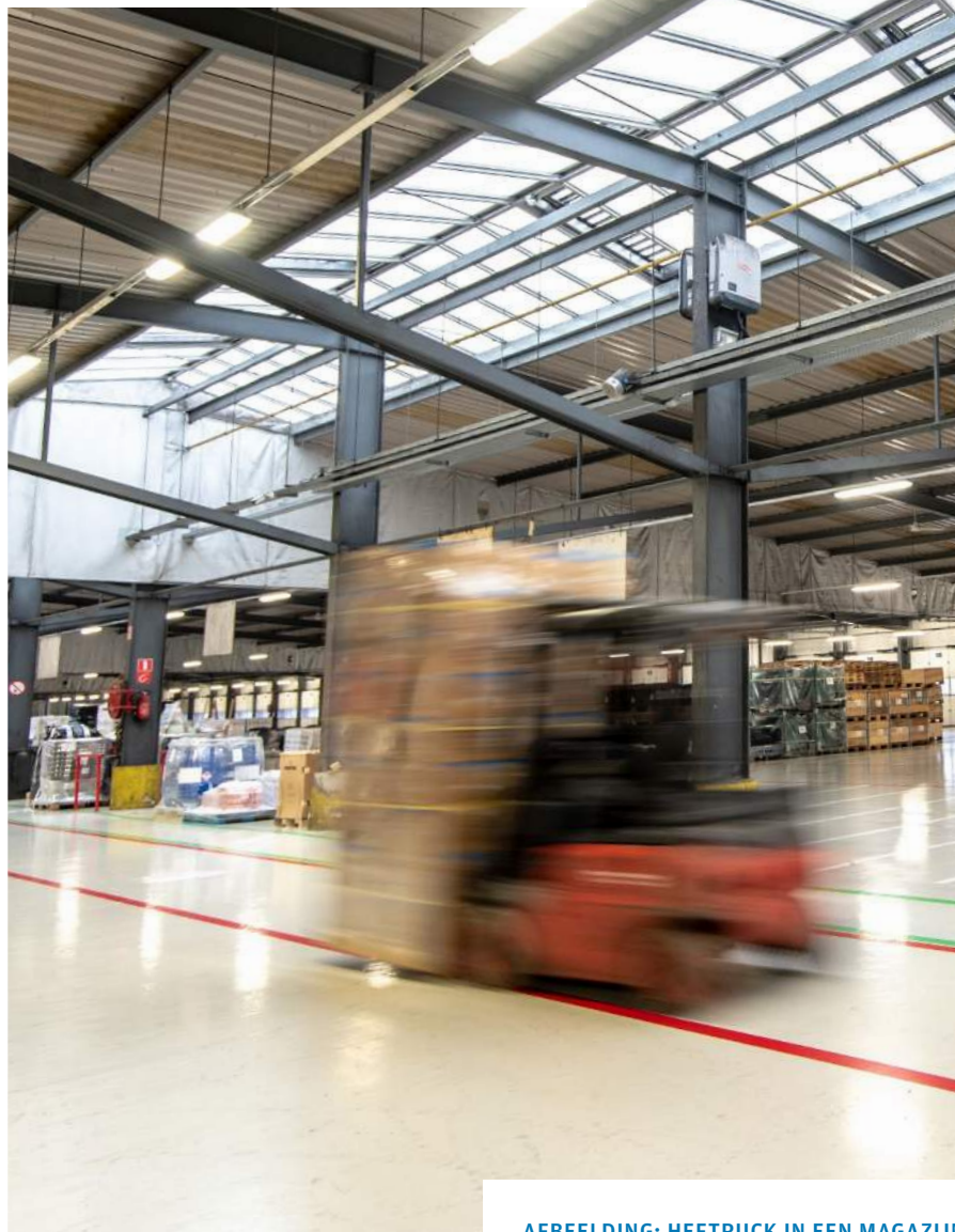
AFBEELDING: HEFTRUCK IN EEN MAGAZIJN