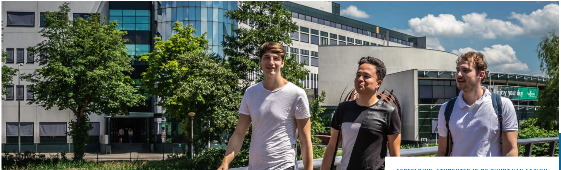
AFBEELDING: STUDENTEN IN DE BUURT VAN SAXION

Daarom zetten we in op het versterken van urgentiebesef om de leercultuur in bedrijven te versterken en eventueel in een aanpak voor het kleinere MKB te voorzien, omdat deze bedrijven daartoe minder toegerust zijn. De sectorale samenwerking is daarbij een belangrijk uitgangspunt. Deze netwerksamenwerking is nodig om werkgevers te informeren over en te betrekken bij de ontwikkeling van een aanpak voor de versterking van de leercultuur in het MKB.