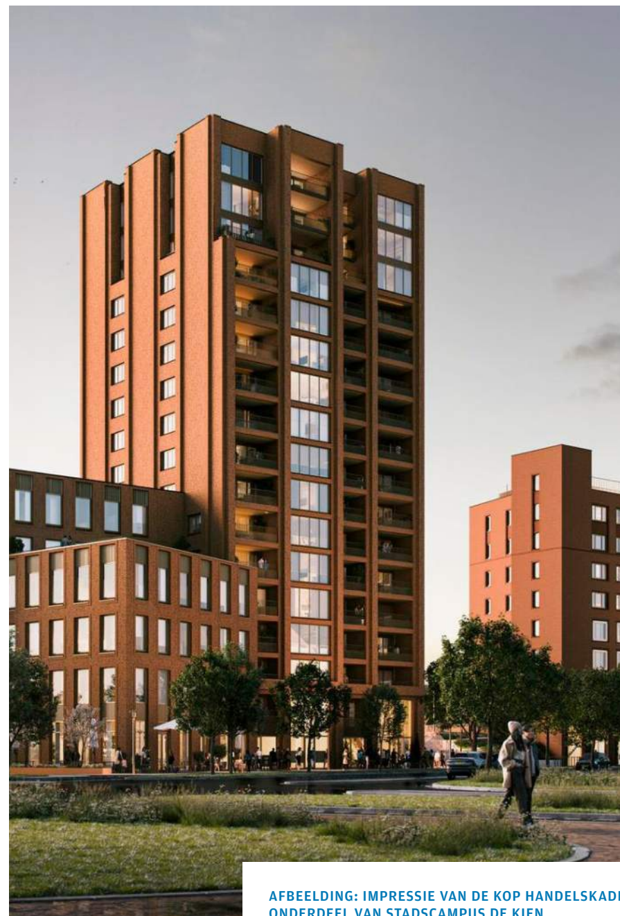
AFBEELDING: IMPRESSIE VAN DE KOP HANDELSKADE, ONDERDEEL VAN STADSCAMPUS DE KIEN

In het DEP zijn MKB Deventer, Deventer Kring van Werkgevers, Bedrijven Parkmanagement, middelbaar en hoger beroepsonderwijs en de gemeente vertegenwoordigd. De eerste resultaten van de 3 DEP projecten: 'Jouw stad als werkgever', 'Stadscampus de Kien', 'Werklocaties van de toekomst' zijn inmiddels concreet zichtbaar. Voor de komende periode zijn, naast de genoemde projecten, 2 bovenliggende programmalijnen benoemd; 'Human Capital' en het 'Creëren van Bedrijvigheid'. Voor de programmalijn Human Capital is in nauwe afstemming met de gemeente een Deventer Human Capital agenda opgesteld. Deze heeft als doel het versterken van de leer- en ontwikkelcultuur van studenten, (potentieel) werkenden en ondernemers in de gemeente Deventer. Deze is gericht op het benutten van ieders talenten en beoogt te investeren in vaardigheden van (potentieel) werkenden. Onder de programmalijn 'Creëren van bedrijvigheid' is het project 'Smart energy hub' toegevoegd, waarmee we de netcongestie aan willen pakken.