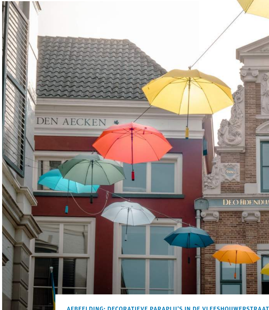
AFBEELDING: DECORATIEVE PARAPLU'S IN DE VLEESHOUWERSTRAAT