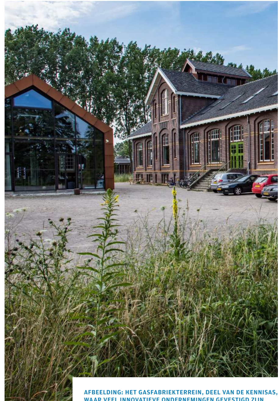
AFBEELDING: HET GASFABRIEKTERREIN, DEEL VAN DE KENNISAS, WAAR VEEL INNOVATIEVE ONDERNEMINGEN GEVESTIGD ZIJN

De innovatie-omgevingen in Deventer zijn nog niet volwassen, maar de perspectieven voor groei zijn gunstig. Wij werken aan de ontwikkeling van de benodigde condities om de innovatiemilieus tot volwassenheid te laten komen. We werken hiertoe samen met bedrijven en onderwijs in de Kien en de Poort van Deventer (Gasfabriek-terrein en S/Park) aan de economische, fysieke en netwerkontwikkeling. In thema 2 is aangegeven hoe ons innovatiebeleid daaraan bijdraagt.