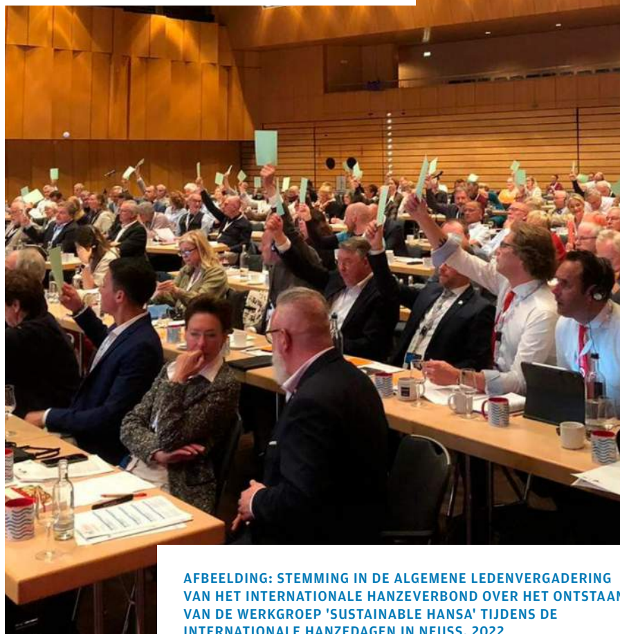
AFBEELDING: STEMMING IN DE ALGEMENE LEDENVERGADERING VAN HET INTERNATIONALE HANZEVERBOND OVER HET ONTSTAAN VAN DE WERKGROEP 'SUSTAINABLE HANSA' TIJDENS DE INTERNATIONALE HANZEDAGEN IN NEUSS, 2022