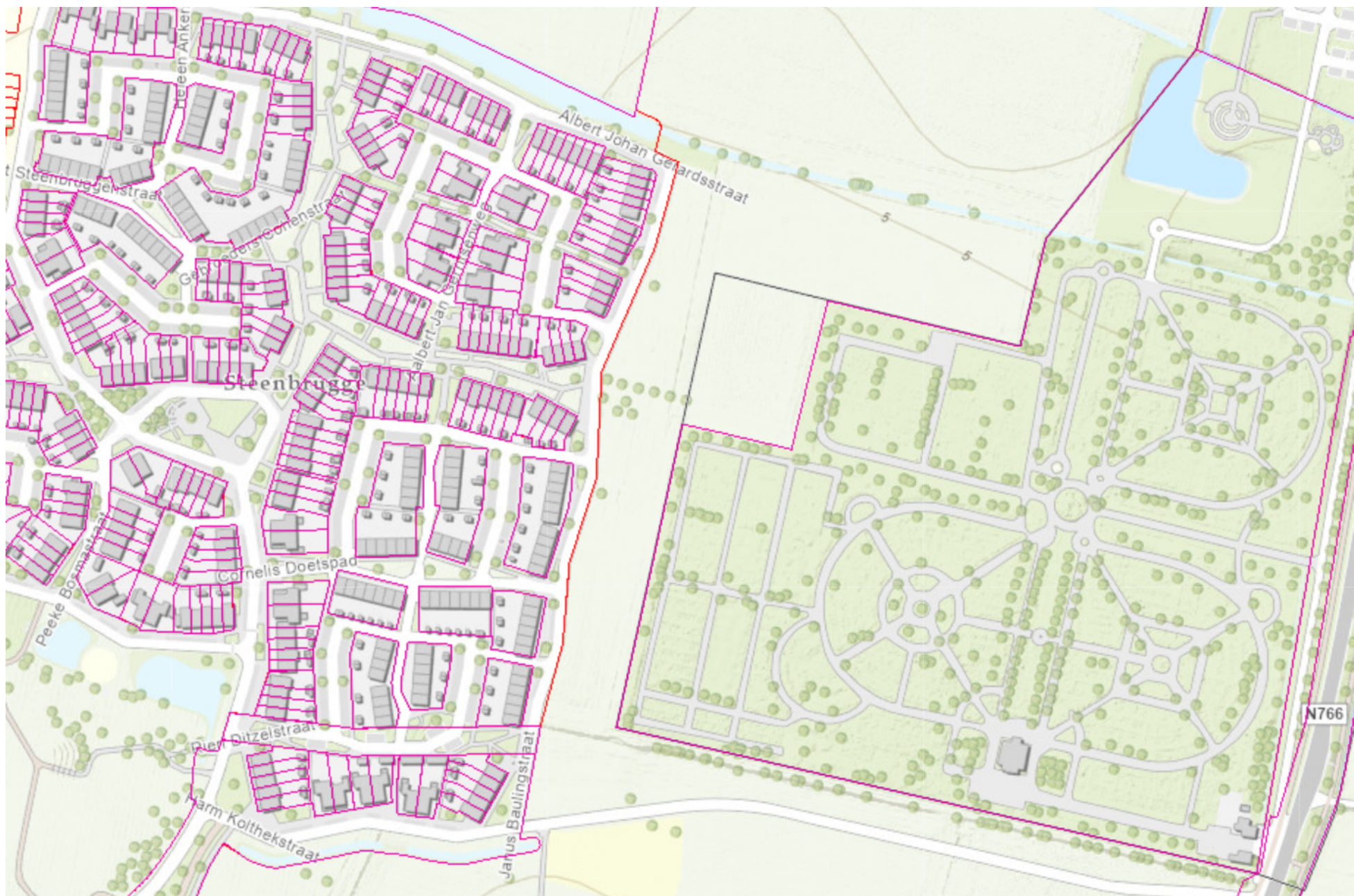
Bijlage 1 - Bestaande situatie