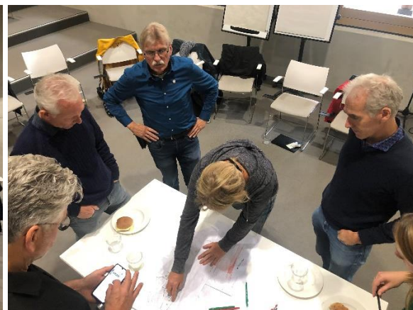
Afbeeldingen Dorpsatelier #1 (Cultuurhuus Braakhekke) en #2 (Dorpskerk) en Omgevingstafel #1 (Stadhuis)