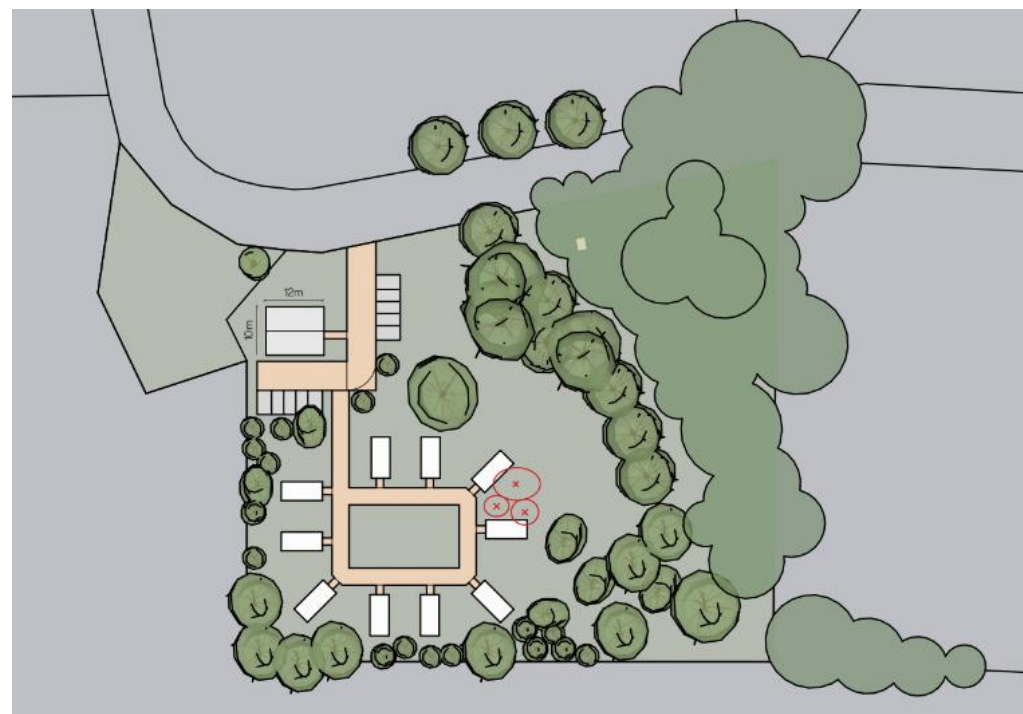
Model mogelijke inpassing Baarler Marsweg