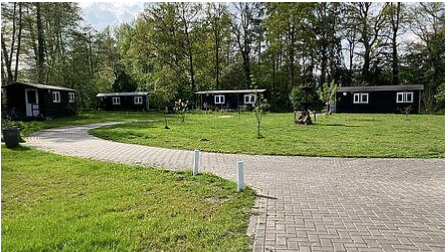
Voorbeeld (andere locatie)