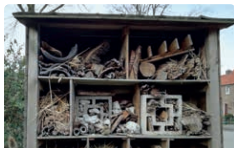
Werkt u mee aan een insectenhotel voor de Plantweerd?

Op vrijdag 9 maart kunt u in het kader van NL-doet meewerken aan een groot insectenhotel in buurttuin de Plantweerd aan de Ruysdaelstraat. Dit onder leiding van de werkgroep Groen van Bewonersvereniging Zandweerd. De Bijenbeweging heeft het initiatief genomen voor deze actie. Deze actie wordt praktisch ondersteund door medewerkers van Het Groenbedrijf.