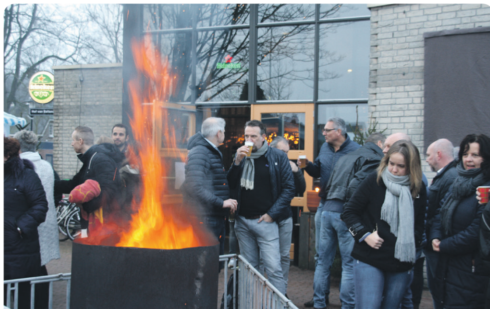
De nieuwjaarsontmoeting van 2018

Komt allen en neem alle gezellige Diepenveners mee, je familie, je burens of je hele straat. Tot 5 januari!