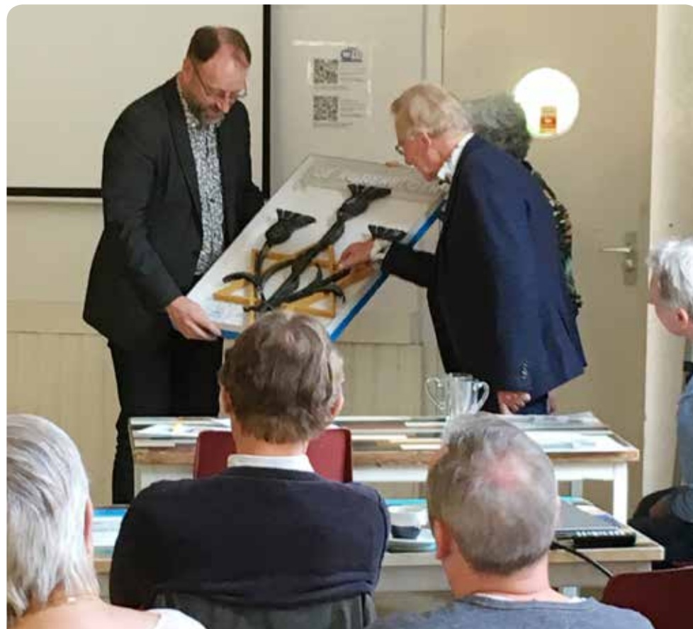
Een nieuwe weergave van het oorspronkelijke ontwerp