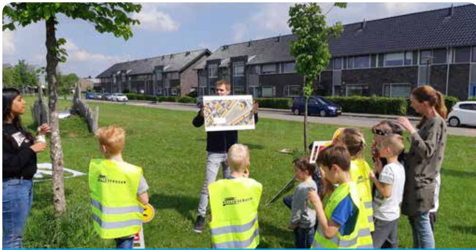
Presentatie van plan speelveld

Op woensdag werd door de kinderen, onder begeleiding van Kinderwerk Raster, hun eigen inrichtingsplan voor het speelveld gepresenteerd. Ook hebben ze ophunspeelveld de hondendrollen gekleurd om duidelijk te maken dat er heel veel lagen. Tenslotte hebben de kinderen samen met toezichthouders met laser-guns de snelheid kunnen meten in hun straten. Met veel enthousiasme werden mensen die te hard reden aangesproken op hun rijgedrag.