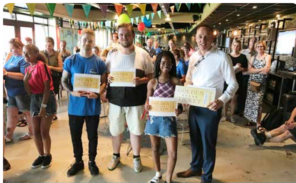
Kinderen en jongeren ontvangen hun Golden ticket uit handen van de Burgemeester (foto: WijDeventer).

De avond was georganiseerd door WijDeventer en Raster. Door de fantastische inzet van alle vrijwilligers en professionals was het een zeer geslaagde avond. Dankjewel aan iedereen!!