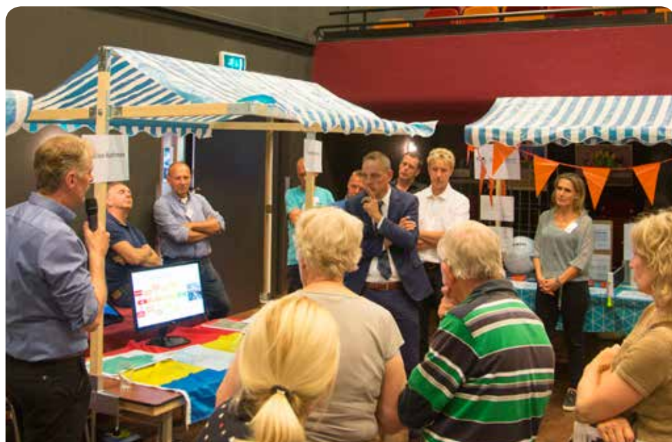
Samen in gesprek bij de marktkramen

Een geslaagde avond met veel enthousiasme en een gezellige sfeer. Ook benieuwd naar de voortgang van één van de werkgroepen? Houdt dan de facebookpagina Dorpsagenda Bathmen in de gaten!