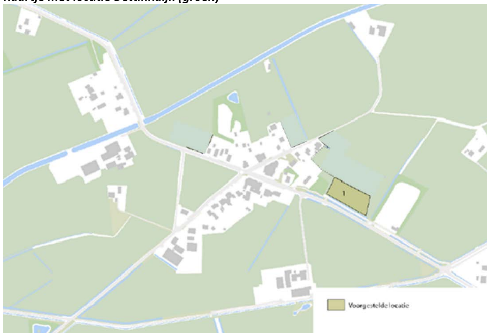
Kaartje met locatie Bettinkdijk (groen)